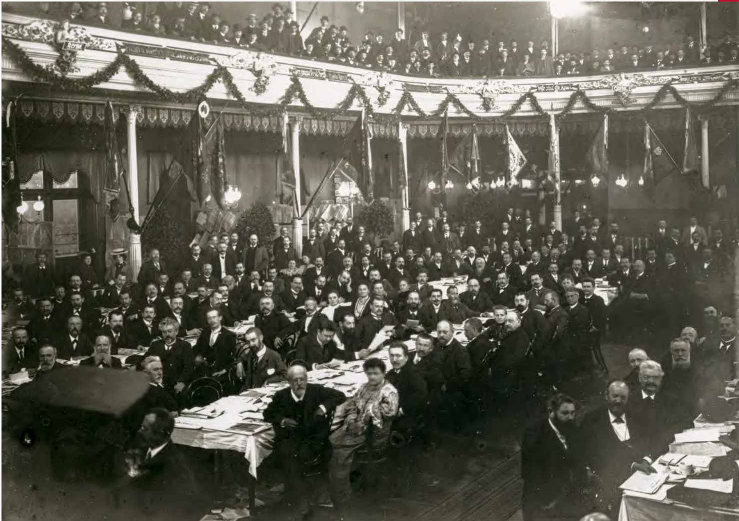
Abb. 08 SPD-Parteitag im Casino, 1904

deutlich, sich nicht an den Arbeitsniederlegungen zum ersten Weltfeiertag der Arbeit am 1. Mai 1890 zu beteiligen, der im Juni 1889 vom Internationalen Arbeiterkongress in Paris beschlossen worden war. Eine Empfehlung, der – bis auf einen geringen Teil der Tischler – auch das Gros der Bremer Arbeiterschaft folgte. Unmittelbar nach dem Auslaufen des sogenannten Sozialistengesetzes gründete sich in Bremen bereits im Dezember 1890 der Sozialdemokratische Verein , nach den vom 12. bis 18. Oktober 1890 frisch beschlossenen Organisa-