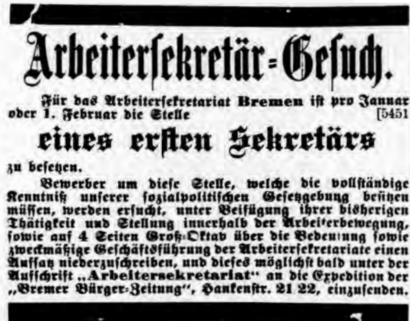
Abb. 09 Das Stellengesuch für den Posten eines Arbeitersekretärs in der Bremer Bürger-Zeitung (BBZ) am 12. November 1899

1894 gründet sich in Bremen das Gewerkschaftskartell , in dem 28 Einzelgewerkschaften mit 4.554 Mitgliedern vertreten sind.